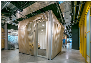
חררי ישיבות מוסים שי הוספה שלה, ביצוע אבי פרידה, במשרדי ALGOTEC (גילום: עדי פורת)