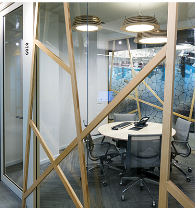
למטה: קיר גבס עם אפיקט של גבע' מחוברים - CA Technologies - ב. (נילוס איוו סיקילסקי)