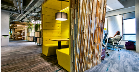
קריים נהרין, ריזון רוביט מכפנים-3 CA Technologies (גילום: איוו סקילסקי)

אדירכלות: סתר אדירכלים אוראות יעוצבו CA Technologies: בלה ונורה אוראות יעוצבו ALGOTEC: שרלי ומר